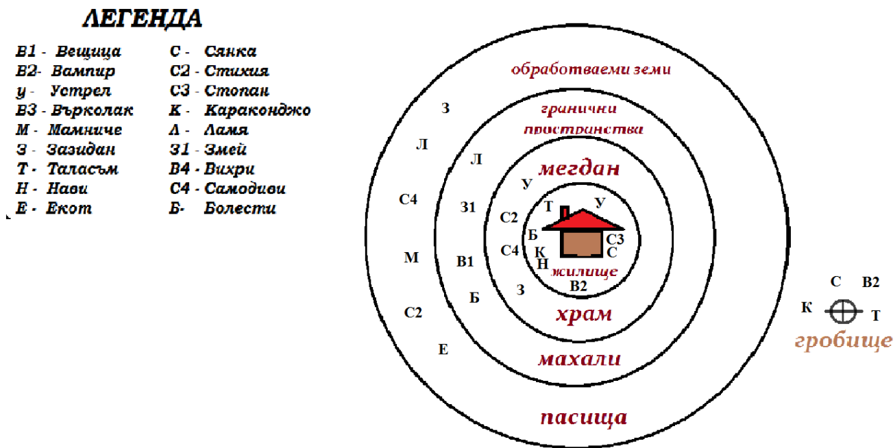
Фигура 1. Селищно пространство – село: